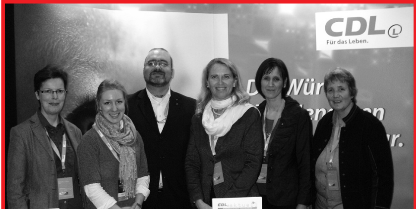
CDL-Bundesvorstandsmitglieder beim CDU-Bundesparteitag

Redaktion: Mechthild Löhr Odila Carbanje