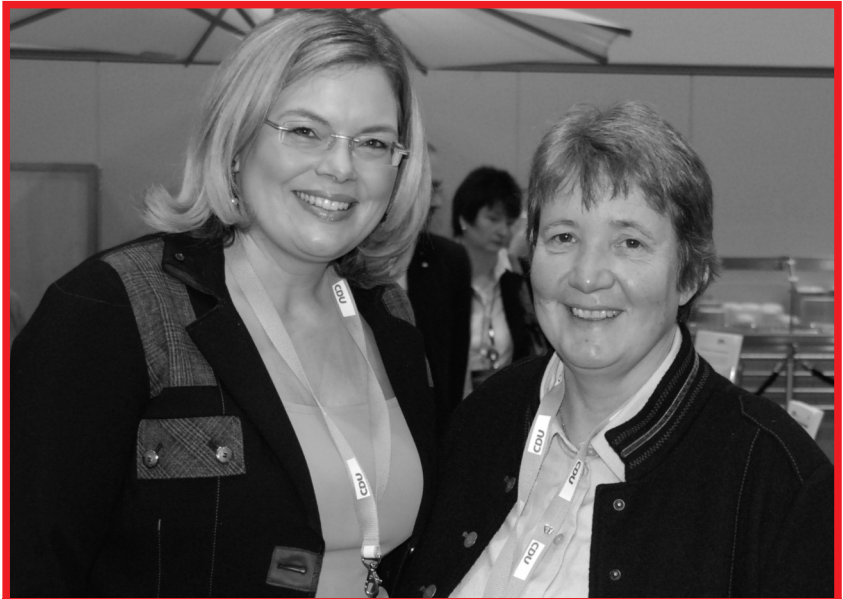
Julia Klöckner beim CDL-Stand auf dem CDU-Bundesparteitag

Wir begrüßen diese Beschwerde, die durch unser CDL-Bundesvorstands-