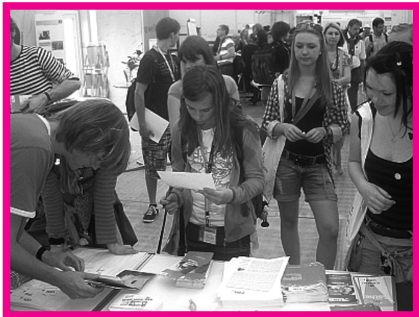
Regel Besucherandrang am CDL-Stand beim evangelischen Kirchentag in Dresden Anfang Juni 2011

Dieses wichtige Manifest, das auch von der Jungen Union ausdrücklich unterstützt wird, ist auf der Webseite der Senioren-Union und der CDL unter www.cdl-online.de zu finden.